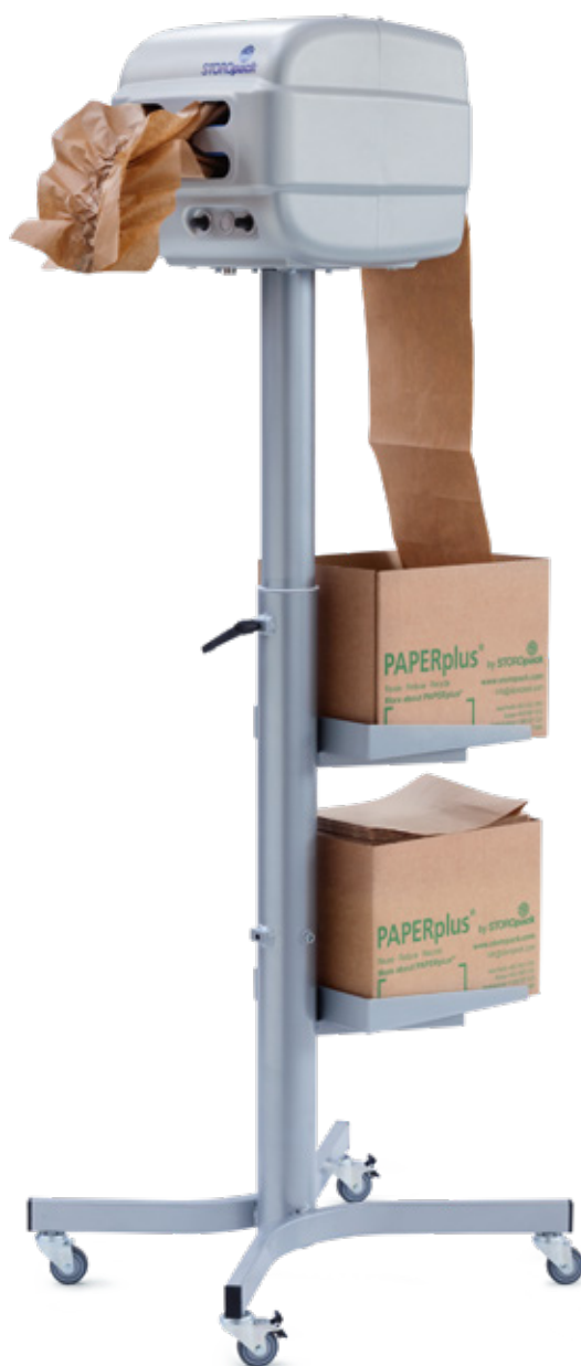
PAPERplus® Papillon model stojący

▶ PAPERplus® Papillon – film o produkcji: www.storopack.com/paperplus-papillon-video