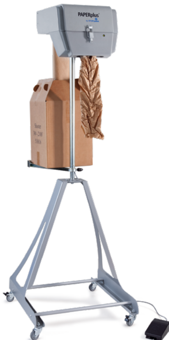
PAPERplus® Shooter model stojący