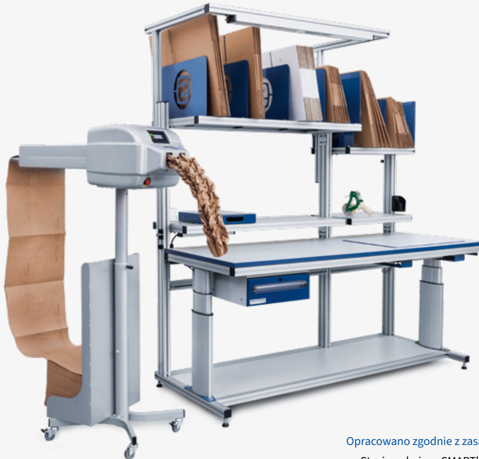
Opracowano zgodnie z zasadą Working Comfort®: Stacja pakująca SMARTline z PAPERplus® Track