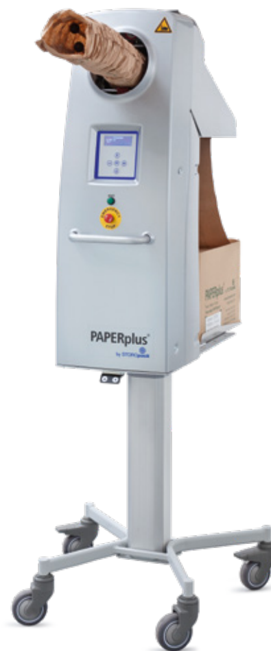
PAPERplus® Chevron 3